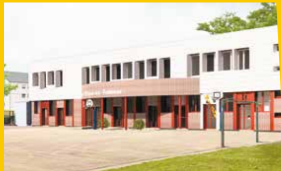
Perspective de la future façade de l'école.

Aussi, la chaufferie de l'école a commencé sa transformation : les premiers équipements permettant le raccordement futur de l'école à la chaufferie bois sont en cours d'installation. La chaudière fioul sera prochainement démantelée.